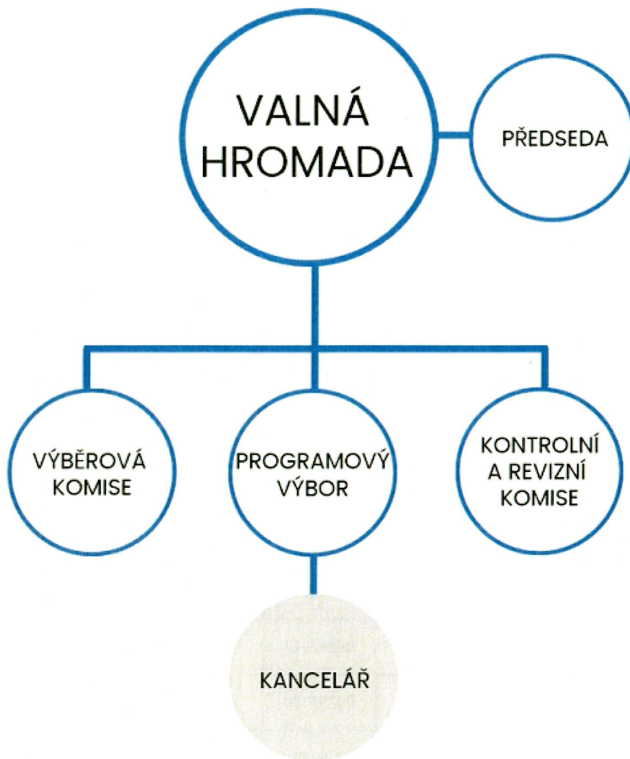
Obrázek 2 Zjednodušená organizační struktura MAS

Spolek je tvořen různými subjekty venkovského prostoru, a to obcemi, neziskovými organizacemi, podnikatelskými subjekty či nepodnikajícími osobami. MAS má v současné době 37 členů/partnerů.