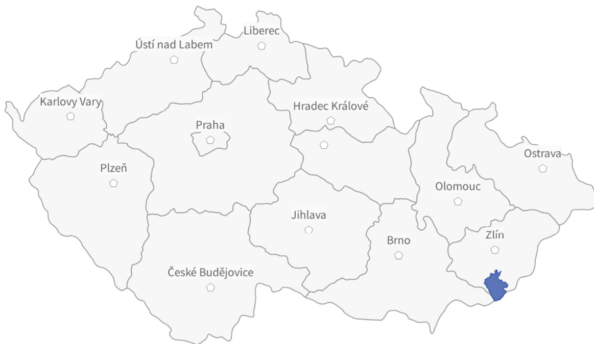
Obrázek 2 Poloha MAS Východní Slovácko, z.s. v rámci krajů České republiky Vlastní zpracování