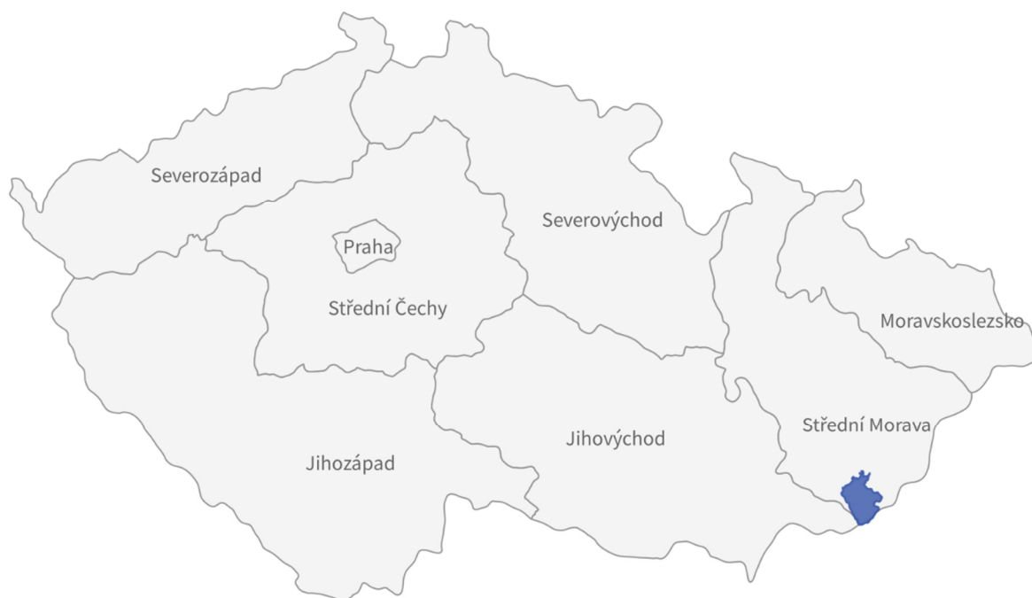
Obrázek 3 Poloha MAS Východní Slovácko, z.s. v rámci regionů soudržnosti NUTS 2 Vlastní zpracování